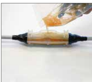
3.- Rellenar torpedo

Retirar barrera entre los componentes y mezclar 1 min. convenientemente hasta lograr un color homogéneo de la misma.