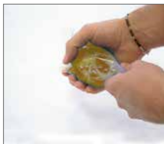
2.- Mezclar componentes

Retirar barrera entre los componentes y mezclar 1 min. convenientemente hasta lograr un color homogéneo de la misma.