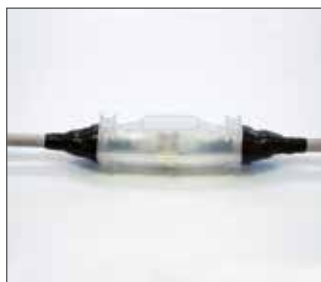
1.- Conectar y cerrar carcasa