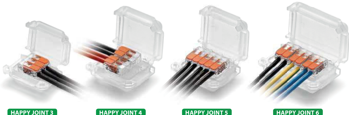
HAPPY JOINT 3