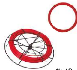
H450 / 620